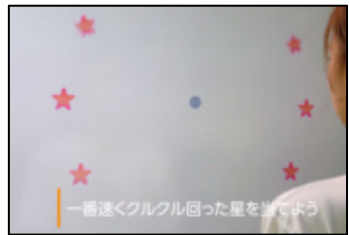
■ かいてん ほしえらび