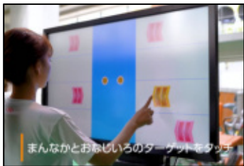
■ 3しょくブロック消し